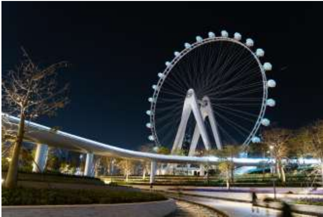
ถึงเวลาอันสมควร นำท่านเดินทางสู่ สยามบิณเซ็นจินเปาอัน

นำท่านไป Happy Harbor หรือ อ่าวแห่งความสุข เป็นแหล่งท่องเที่ยวที่มีบรรยากาศทันสมัย มีไฮไลต์คือชิงช้าสวรรค์ขนาดยักษ์ "Oh Bay" ที่คุณสามารถชมวิวเมืองเซ็นจินได้อย่างสวยงาม นอกจากนี้ยังมีร้านอาหาร คาเฟ่ และมีการแสดงน้ำพุดนตรีในยามค่ำคืน