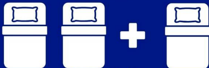
ห้องพักสำหรับสามท่าน (ที่นอนเสริม) TRIPLE BED ROOM (TRP)