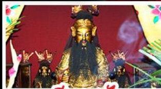
เฮียงบูชิว