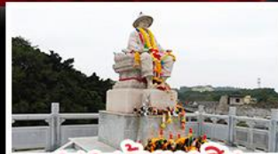
พระเจ้าตากสิน