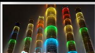
น้ำพุไม้ไฟตีกSKP