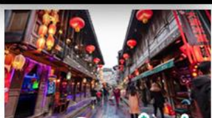
ถนนโบราณจิมหลี่