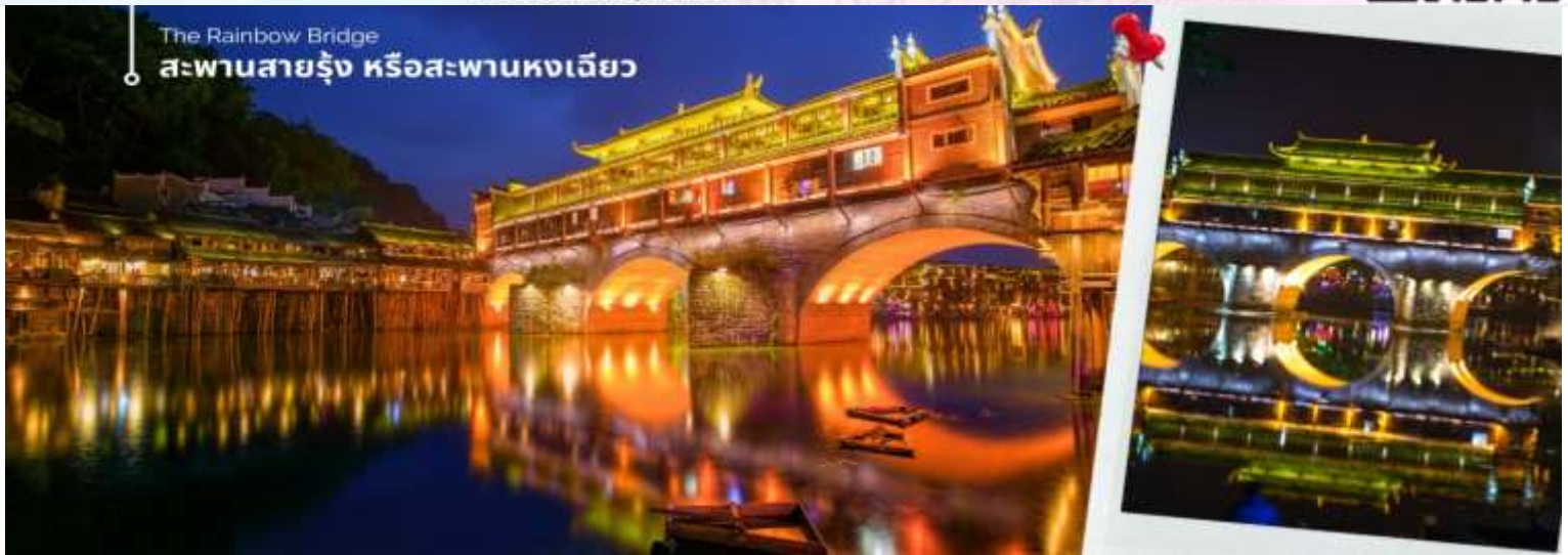
The Rainbow Bridge สะพานสายรุ้ง หรือสะพานหงเจียว

จากนั้นอิสระชมวิวมืองโบราณเฟิงหวงยามค่ำคืน และให้ทุกท่านอิสระได้ถ่ายรูปกับชุดชนเผ่าจินโบราณของเมืองเฟิงหวงตามอริยาศัย ฟรีชุดชนเผ่าท้องถิ่น (ไม่รวมค่าแต่งหน้าทำผมและเครื่องประดับ)