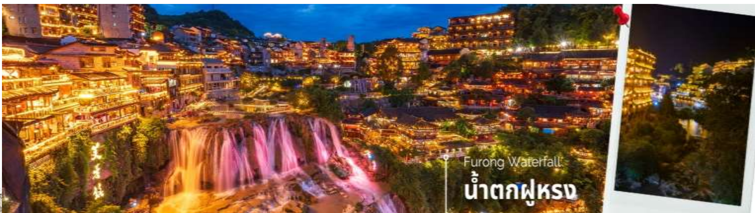
Furong Waterfall น้ำตกฝูหลง

นำท่านเที่ยวชม เมืองโบราณฝูหลงเจิ้น เมืองโบราณเก่าแก่ที่ขึ้นชื่อ ของมณฑลหูหนานเป็นสถานที่ท่องเที่ยวระดับ 4A ที่ได้รับความนิยมจากนักท่องเที่ยวคู่กับเมืองโบราณเฟิงหวง เคยเป็นสถานที่ถ่ายทำภาพยนตร์เรื่อง ฝูหลงเจิ้น ทำให้สถานที่แห่งนี้ยิ่งได้รับความนิยมจากนักท่องเที่ยว จุดไฮไลท์ของเมืองโบราณแห่งนี้ นอกจากบ้านเรือนโบราณที่เป็นเอกลักษณ์เฉพาะของมณฑล หูหนาน ที่นี่ยังมีน้ำตกที่สวยงามกลางเมืองที่เป็นจุดเช็คอินยอดนิยมสำหรับนักท่องเที่ยว นำท่านล่องเรือชมความงามของเมืองโบราณและน้ำตกที่ไหลผ่านบริเวณเมืองโบราณ ซึ่งเป็นการเพิ่มเสน่ห์ให้กับเมืองโบราณแห่งนี้