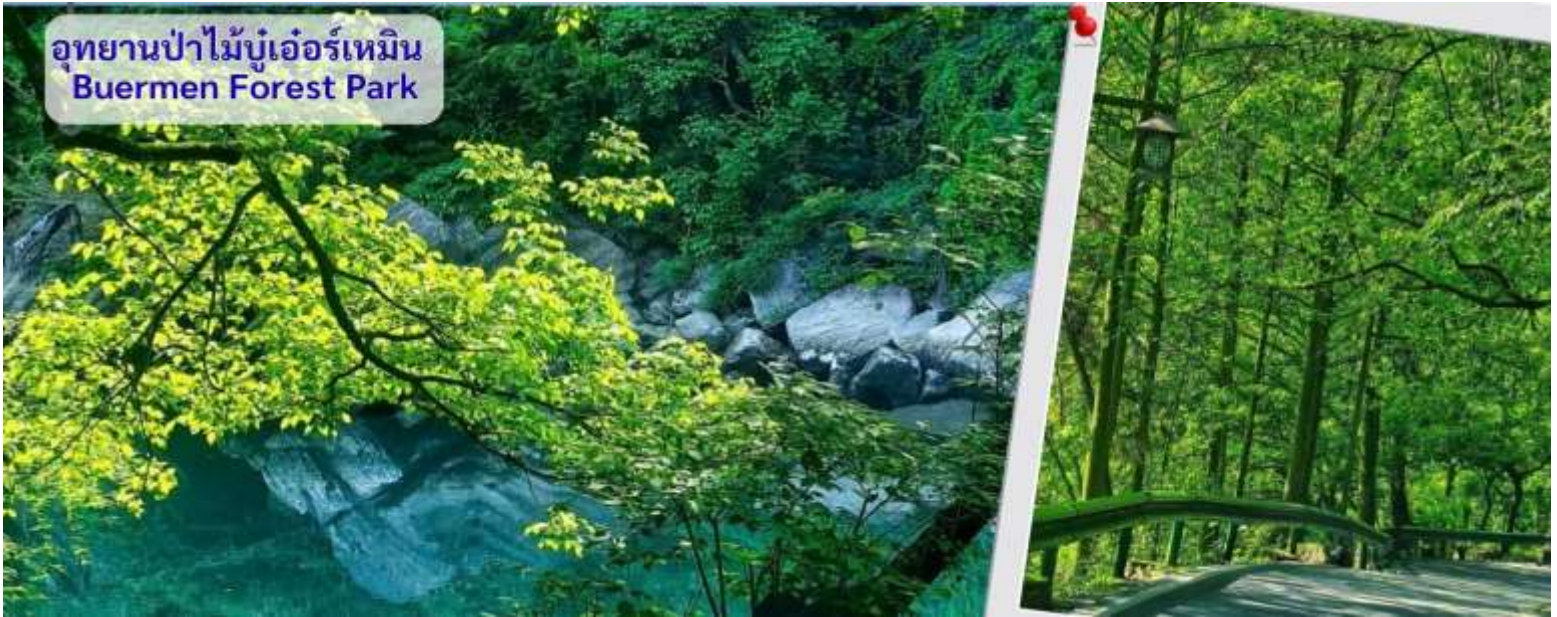
อุทยานป่าไม้บูเออร์เหมิน Buermen Forest Park

ครอบคลุมพื้นที่กว่า 5,000 เฮกตาร์ โดยมีพื้นที่ป่าไม้ถึง 92% ของอุทยาน โดดเด่นในเรื่องของไฮทihnรูปทรงประหลาด บ่อน้ำพุร้อนธรรมชาติ และงานแกะสลักหินโบราณ โดยเฉพาะเพื่อแช่น้ำพุร้อนและชมธรรมชาติภูเขาหินสวย ๆ