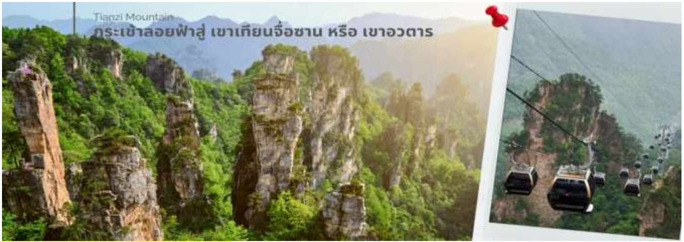
Tianzi Mountain กระเช้าลอยฟ้าสู่ เขาเทียนจื่อซาน หรือ เขาอวตาร

ตะวันออก ทิศใต้และทิศตะวันตกของเขาเทียนจื่อซานที่เต็มไปด้วย ผาสูงชัน เหวลึก และป่าหิน หินยักษ์ในรูปลักษณะต่างๆ เขาเทียนจื่อซานก็ยังเป็นที่ถ่ายทำภาพยนตร์ชื่อดัง เรื่อง อวตาร อีกด้วย