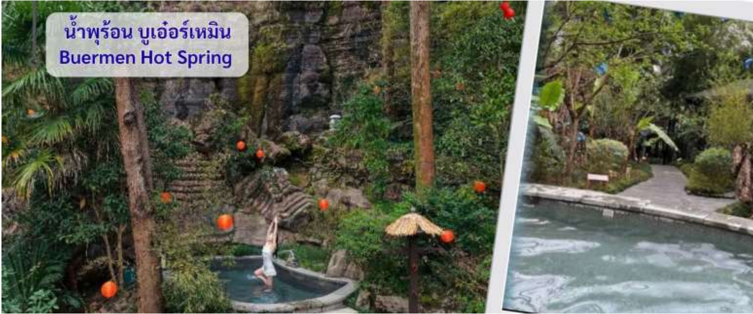
น้ำพุร้อน บูเออร์เหมิน Buermen Hot Spring