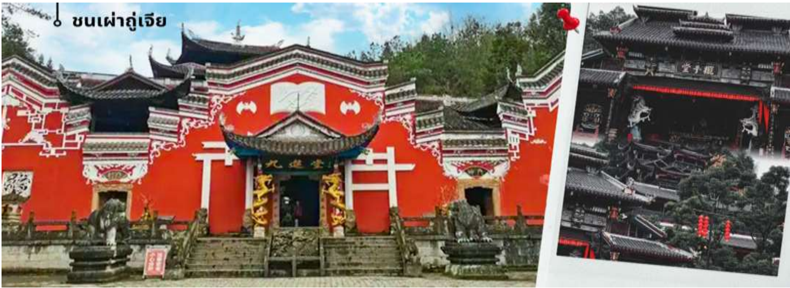
↳ ชนเผ่าถู่เจีย

จากนั้นนำทุกท่านเดินทางสู่ ป่าหินชั่วปู่หย้า (Suobuya Stone Forest) คือ เป็นสถานที่ท่องเที่ยวระดับชาติเกรด AAAA ของจีน ตั้งอยู่ห่างจากเมืองเอนซี มณฑลหูเป่ย์ ไปทางเหนือ 54 กิโลเมตร ในภาคกลางของจีน ได้ รับการขนาน นามว่าเป็นป่าหินที่ใหญ่เป็นอันดับสองของจีน (อันดับแรกคือป่าหินในเมืองคุนหมิง มณฑลยูนนาน ทางตะวันตกเฉียงใต้ของจีน) และ เป็นสถานที่ที่นักท่องเที่ยวชื่นชอบ สามหุบเขาของแม่น้ำแยงซีต้องไปเยือน ครอบคลุมพื้นที่ทั้งหมด 21 ตาราง กิโลเมตร ระดับความสูงเฉลี่ยมากกว่า 900 เมตร หากมองจากมุมสูง พื้นที่ท่องเที่ยวแห่งนี้มีรูปร่างคล้ายน้ำเต้าขนาดใหญ่ ล้อมรอบด้วยฉากสีเขียวและยอดเขา ป่าหินซูโอบูยาเป็นป่าหินที่ใหญ่เป็นอันดับสองของจีน โดยมีพิชพรรณเป็นอันดับหนึ่งของประเทศ และนี่คือสิ่งที่ทำให้โดดเด่นกว่าหินปูนอื่นๆ ในภาคตะวันตกเฉียงใต้ของจีน ป่าหินซูโอบูยามีพิชพรรณขึ้นปกคลุมอย่างหนาแน่นราวกับสวมหมวก จึงได้ชื่อว่า ป่าหินสวมหมวก