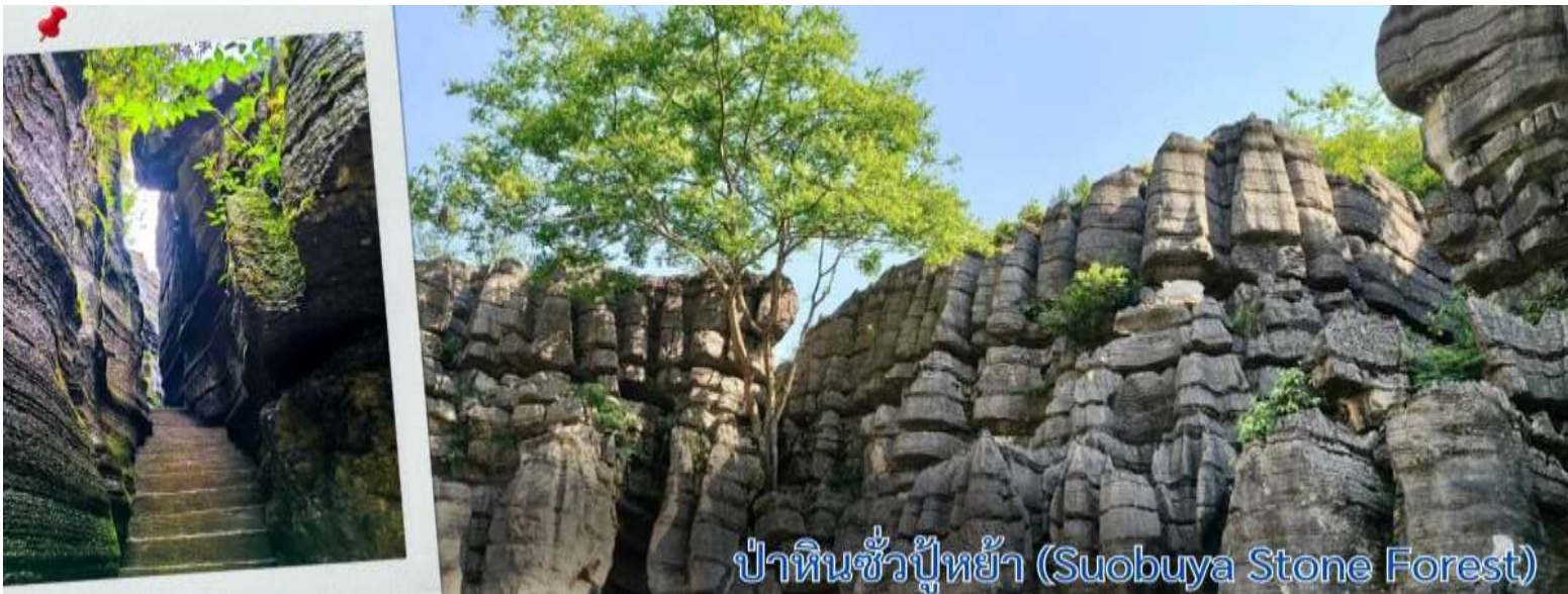
ป่าหินชั่วปู่หย้า (Suobuya Stone Forest)

จากนั้นนำทุกท่านเดินทางสู่ ป่าหินชั่วปู่หย้า (Suobuya Stone Forest) คือ เป็นสถานที่ท่องเที่ยวระดับชาติเกรด AAAA ของจีน ตั้งอยู่ห่างจากเมืองเอนซี มณฑลหูเป่ย์ ไปทางเหนือ 54 กิโลเมตร ในภาคกลางของจีน ได้ รับการขนาน นามว่าเป็นป่าหินที่ใหญ่เป็นอันดับสองของจีน (อันดับแรกคือป่าหินในเมืองคุนหมิง มณฑลยูนนาน ทางตะวันตกเฉียงใต้ของจีน) และ เป็นสถานที่ที่นักท่องเที่ยวชื่นชอบ สามหุบเขาของแม่น้ำแยงซีต้องไปเยือน ครอบคลุมพื้นที่ทั้งหมด 21 ตาราง กิโลเมตร ระดับความสูงเฉลี่ยมากกว่า 900 เมตร หากมองจากมุมสูง พื้นที่ท่องเที่ยวแห่งนี้มีรูปร่างคล้ายน้ำเต้าขนาดใหญ่ ล้อมรอบด้วยฉากสีเขียวและยอดเขา ป่าหินซูโอบูยาเป็นป่าหินที่ใหญ่เป็นอันดับสองของจีน โดยมีพิชพรรณเป็นอันดับหนึ่งของประเทศ และนี่คือสิ่งที่ทำให้โดดเด่นกว่าหินปูนอื่นๆ ในภาคตะวันตกเฉียงใต้ของจีน ป่าหินซูโอบูยามีพิชพรรณขึ้นปกคลุมอย่างหนาแน่นราวกับสวมหมวก จึงได้ชื่อว่า ป่าหินสวมหมวก