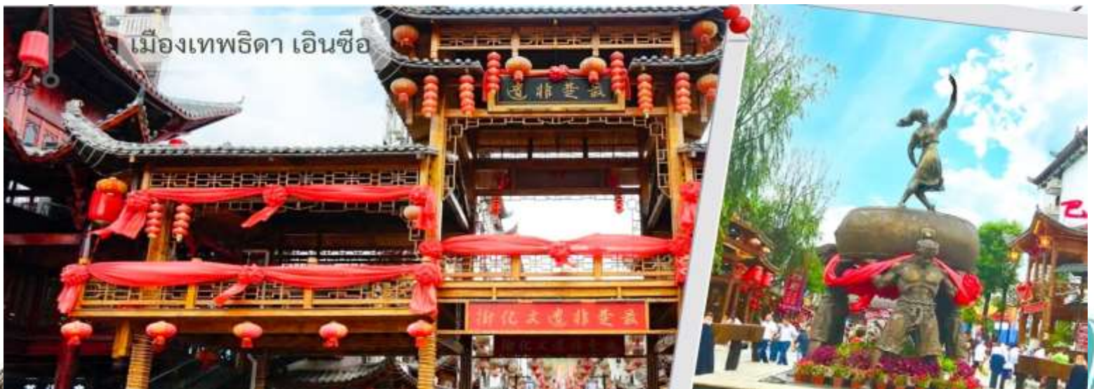
เมืองเทพริดา เอนซือ

จากนั้นนำท่านเดินทางสู่ เมืองเทพริดา เมืองเอนซือ เป็นเมืองจำลองที่โด่งดังของเมืองเอนซือ เป็นสถานที่ท่องเที่ยวระดับ AAAA (4A) ✨ ตั้งอยู่ในเมืองเอนซือ ทางตะวันตกเฉียงใต้ของมณฑลหูเป่ย์ ใจกลางเขตปกครองตนเองเอนซือฉู่เจียและเหมียว พื้นที่แห่งนี้เป็นถิ่นฐานของชาวฉู่เจียมาตั้งแต่สมัยโบราณ เมืองริดาเอนซือฉู่เจีย ไม่เพียงแต่เป็นสถานที่สำคัญทาง