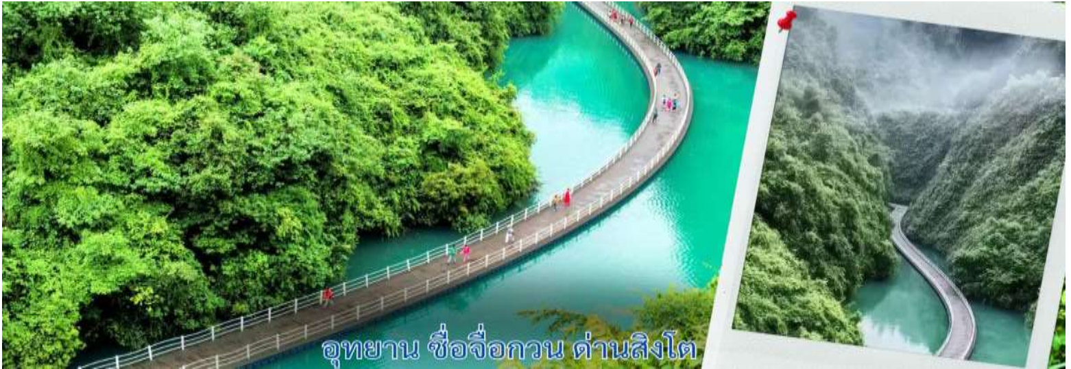
อุทยาน ชื่อจื่อกวน ด้านสิงโต

สะพานนี้ถือเป็นหนึ่งใน สะพานลอยน้ำที่ยาวและสวยที่สุดในจีน รถอุทยานสามารถวิ่งข้ามสะพานได้ ตอนเล่นผ่านคือทั้ง ตื่นเต้นและประทับใจมาก เพราะวิวรอบตัวคือภูเขาเขียวขจีและผืนน้ำที่สะท้อนท้องฟ้าอย่างสวยงาม