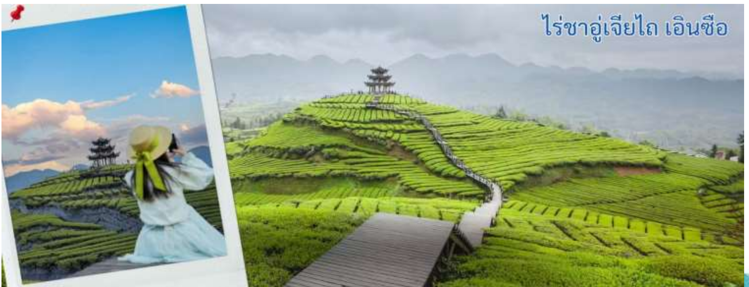
ไร่ชาอู่เจียไถ เอ็นซือ

หลังจากรับประทานอาหารกลางวัน นำทุกท่านเดินชม ภูเขาใบชาอู่เจียไถ คือแหล่งมรดกโลกที่ตั้งอยู่ในเขตภูเขา มณฑลชานซี ประเทศสาธารณรัฐประชาชนจีน เป็นหนึ่งในสี่ภูเขาอันศักดิ์สิทธิ์ทางพุทธศาสนาของจีน ณ ภูเขาอู่ไถแห่งนี้เป็นที่ประทับของพระมัญชุศรีโพธิสัตว์ ธรรมราชกุมารในคติของพระพุทธศาสนาหายาน ได้รับการจัดระดับโดยคณะกรรมการจัดระดับคุณภาพสถานที่ท่องเที่ยวแห่งประเทศไทยระดับ 5A เมื่อปี 2550 ภูเขาใบชาอู่เจียไถ ตั้งอยู่ในเขตชวนเอน มณฑลหูเป่ย์ ประเทศจีน เป็นแหล่งผลิตชาคุณภาพสูงที่มีชื่อเสียง โดยเฉพาะชา กังฉา ซึ่งเคยเป็นชาชั้นสูงที่ถวายแด่ฮ่องเต้ในอดีต แม้ว่าข้อมูลในวิกิพีเดียภาษาไทยจะเน้นไปที่เขาผู้ถั่ว (ที่ประทับพระแม่กวนอิม) หรือเขาอู่ไถ (หนึ่งในสี่ภูเขาศักดิ์สิทธิ์) แต่ อู่เจียไถ เป็นที่รู้จักในฐานะไร่ชาที่มีทิวทัศน์สวยงามและผลิตชาชั้นดี มีการจำหน่ายและให้ชิมชาชา ชาเขียว และชาท้องถิ่น