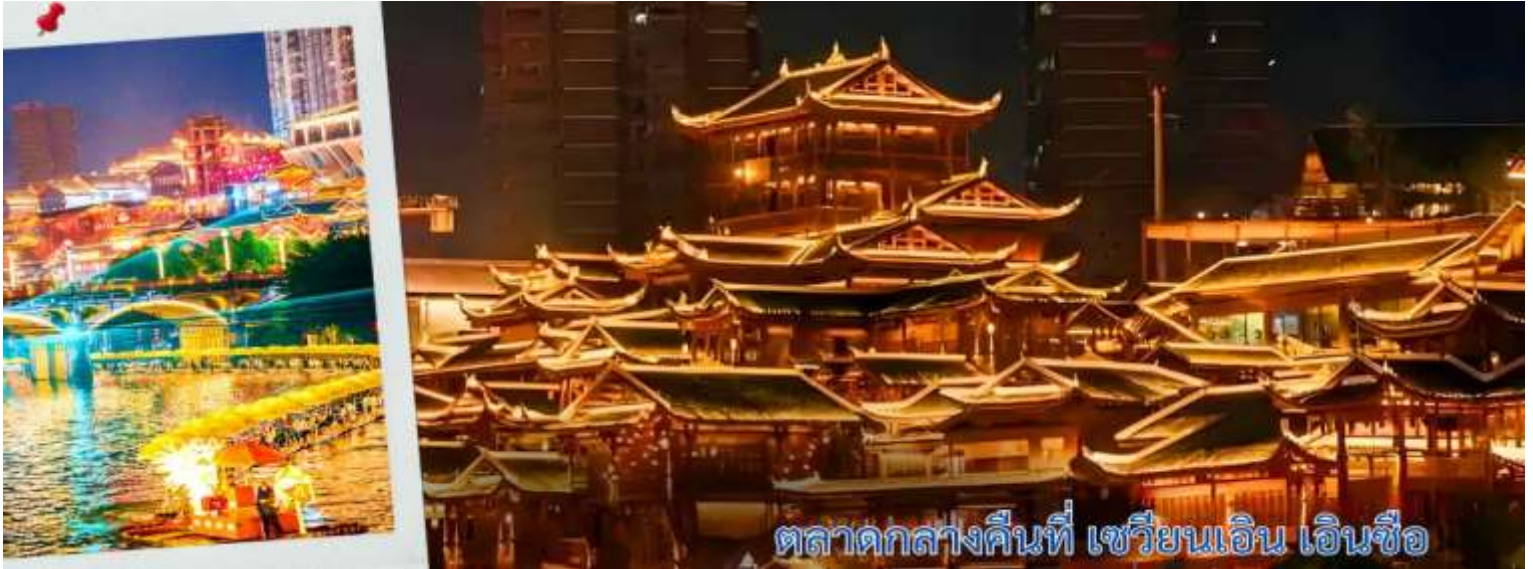
ตลาดกลางคืนที่ เซวียนเอน เอ็นชือ

จากนั้นนำทุกท่านเดินทางชมวิวกลางคืนเซวียนเอน วิวกลางคืนที่ เซวียนเอน (Xuan'en) มณฑลหูเป่ย์ โดดเด่นด้วยบรรยากาศเมืองโบราณที่ผสมผสานธรรมชาติกับวัฒนธรรม โดยเฉพาะการแสดงแสงสีเสียงริมน้ำที่ ถนนเก่าซิงหลง และไฮไลต์อย่างการล่องเรือชมการแสดงน้ำพุเลเซอร์และจั่วเปลี่ยนหน้า นอกจากนี้ยังมีตลาดกลางคืน และกิจกรรมรอบกองไฟที่สะท้อนวัฒนธรรมชนเผ่าอู๋เจีย ทำให้เซวียนเอนเป็นจุดหมายที่สวยงามทั้งกลางวันและกลางคืน