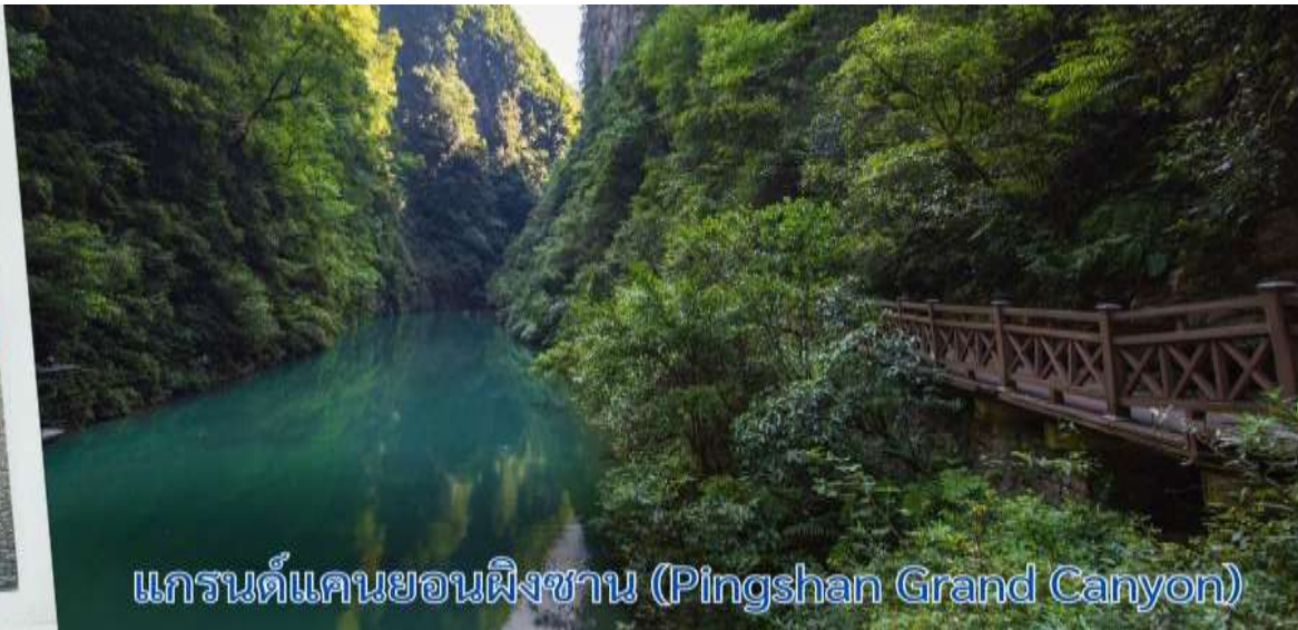
แกรนด์แคนยอนผิงซาน (Pingshan Grand Canyon)

เที่ยง รับประทานอาหารกลางวัน ณ ภัตตาคาร (6)