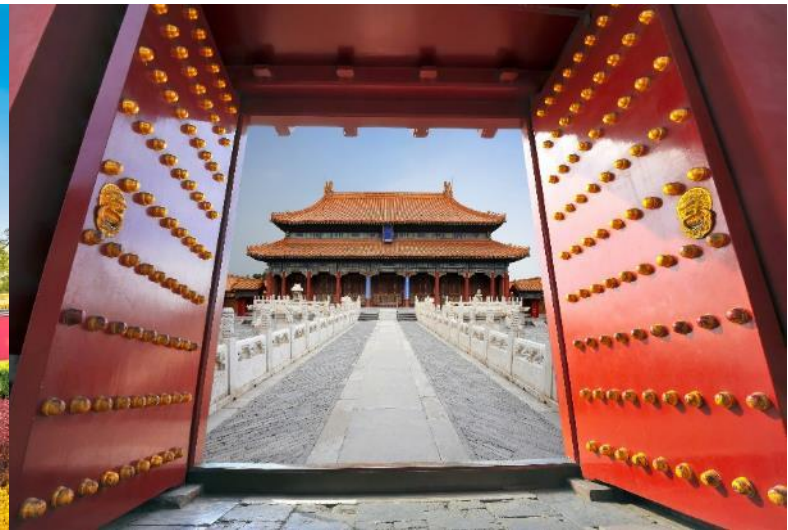
ตั้งอยู่ท่ามกลางสวนที่สวยงาม เต็มไปด้วยต้นไม้ ดอกไม้

**ในกรณีที่พระราชวังต้องห้ามกุ๊กง ไม่สามารถเข้าได้ จำนวนผู้เข้าชมมากเกินกำหนดต่อวัน หรือโดนสั่งปิดจากทางรัฐบาล กักขังปิดทางธรรมชาติ และในกรณีอื่นใดก็ตาม ทั้งนี้ ทางบริษัทฯ ขอสงวนสิทธิ์ปรับเป็น ชมพระราชวังองค์ชายน้อย โดยคำนึงถึงความปลอดภัยของท่านเป็นหลัก แทนโดยไม่แจ้งให้ทราบล่วงหน้า ทุกกรณี