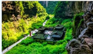
อุทยานแห่งชาติหลุมฟ้า