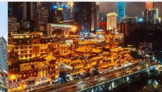
หงหยาดัง(ชมไฟฟ้ายามค่ำคืน)

*ทางบริษัทฯ ขอสงวนสิทธิ์ในการสลับโปรแกรมทัวร์ตามความเหมาะสมขึ้นอยู่กับสถานการณ์ทำงาน โดยคำนึงถึงผลประโยชน์ของลูกค้าเป็นสำคัญ