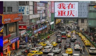
กวนอิมเจียว

*ทางบริษัทฯ ขอสงวนสิทธิ์ในการสลับโปรแกรมทัวร์ตามความเหมาะสมขึ้นอยู่กับสถานการณ์หน้างาน โดยคำนึงถึงผลประโยชน์ของลูกค้าเป็นสำคัญ