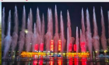
น้ำพุคังปาซ้อ