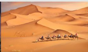
ทะเลทรายเลี้ยงชวาน