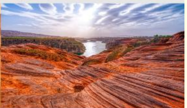
อุทยานหุบเขาคลิน

*ทางบริษัทฯ ขอสงวนสิทธิ์ในการสลับโปรแกรมทัวร์ตามความเหมาะสมขึ้นอยู่กับสถานการณ์หน้างาน โดยคำนึงถึงผลประโยชน์ของลูกค้าเป็นสำคัญ