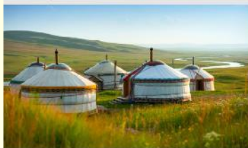
ทุ่งหญ้ออร์ดอส