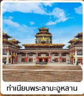
ทำเนียบพระลามะอูหลาน