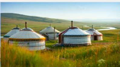
ที่พักแบบกระโจม