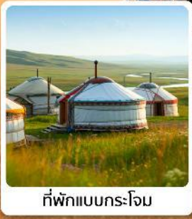
ที่พักแบบกระโจม