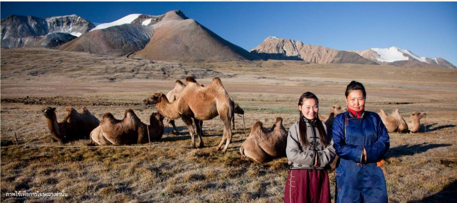
ภาพใช้เพื่อการโฆษณาเท่านั้น

นำท่านร่วมกิจกรรม พิธีต้อนรับแขกสไตล์มองโกล เป็นประเพณีโบราณที่มีมาช้านาน ชาวมองโกลมีอุปนิสัยที่รักเพื่อนฝูงและตรงไปตรงมาไม่เสแสร้ง เมื่อมีเพื่อนหรือแขกมาเยือนก็มักจะผูกมิตรอย่างจริงจัง และนำท่านร่วมกิจกรรม สวมใส่ชุดมองโกล สัมผัสพลังแห่งบรรพบุรุษ สวมเสื้อคลุมแบบดั้งเดิมที่มีสีสันสดใส ปักลวดลายอันประณีต คุณจะสัมผัสได้ถึงพลังแห่งบรรพบุรุษที่เคยปกครองดินแดนครึ่งโลก การสวมหมวกขนสัตว์ ผูกสายรัดเอว พร้อมเครื่องประดับเงินแท้ที่ส่องแสงระยิบระยับ จะทำให้ท่านเสมือนกลายเป็นนักรบแห่งทุ่งหญ้า พร้อมเครื่องประดับเงินแท้ที่ส่องแสงระยิบระยับ ของชนเผ่าที่เคยปกครองดินแดนครึ่งโลก เมื่อคุณยืนท่ามกลางทุ่งหญ้าไร้ขอบเขต