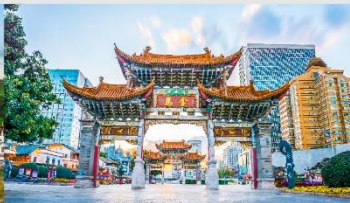
ประตูม้าทองไก่หยก