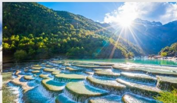
ทะเลสาบไปสุยเหอ

*ทางบริษัทฯ ขอสงวนสิทธิ์ในการสลับโปรแกรมทัวร์ตามความเหมาะสมขึ้นอยู่กับสถานการณ์หน้างาน โดยคำนึงถึงผลประโยชน์ของลูกค้าเป็นสำคัญ