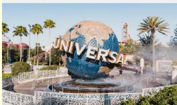
สวนสนุกยูนิเวอร์เซลปักกิ่งสตูดิโอ