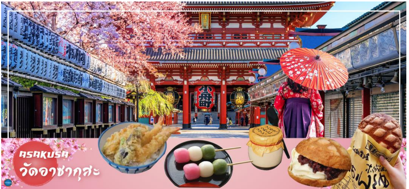
Asakusa วัดอาซากุสะ

ถ่ายรูปโตเกียวสกายทรี ริมน้ำสุมิดะ – ชมแมวยักษ์ 3 มิติ พร้อมซอปปิง ย่านชินจูกุ – เมืองนาริตะ