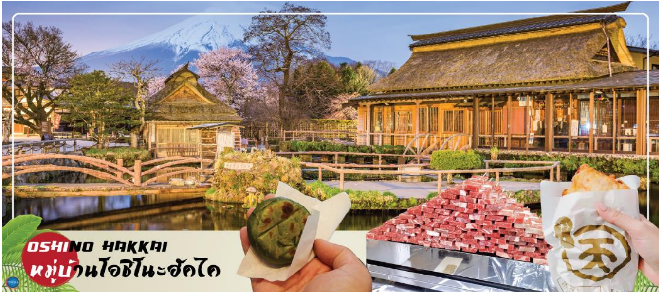
OSHINO HAKKAI หมู่บ้านโอชิโนะฮักไก

แอบสงสัยว่าน้องปลาไม่หนาวสะท้านกันบ้างหรือ เพราะอุณหภูมิในน้ำเฉลี่ยอยู่ที่ 10-12 องศาเซลเซียสนอกจากชมแล้วก็ยังมีน้ำพุจากธรรมชาติให้ดื่มตามอัธยาศัย และที่สำคัญ หมู่บ้านโอชิโนะยังเป็นที่แหล่งช้อปปิ้งสินค้าโอท็อปชั้นเยี่ยมอีกด้วย