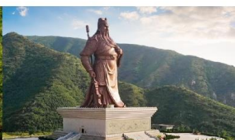
บ้านเกิดกวนอู