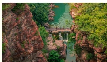
อุทยานสวรรค์หยุนโดซาน