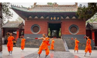
ชมโชว์กังฟูเส้าหลิน

*ทางบริษัทฯ ขอสงวนสิทธิ์ในการสลับโปรแกรมทัวร์ตามความเหมาะสมขึ้นอยู่กับสถานการณ์หน้างาน โดยคำนึงถึงผลประโยชน์ของลูกค้าเป็นสำคัญ