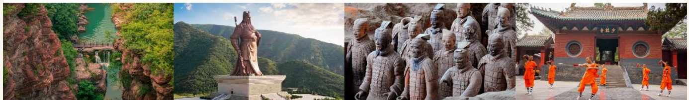
อุทยานสวรรค์หยุนโกซาน