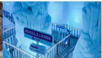
ถ้ำน้ำแข็งอวี่นชีวซาน

*ทางบริษัทฯ ขอสงวนสิทธิ์ในการสลับโปรแกรมทัวร์ตามความเหมาะสมขึ้นอยู่กับสถานการณ์หน้างาน โดยคำนึงถึงผลประโยชน์ของลูกค้าเป็นสำคัญ