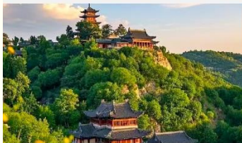
เขาเหยาหวังชาน