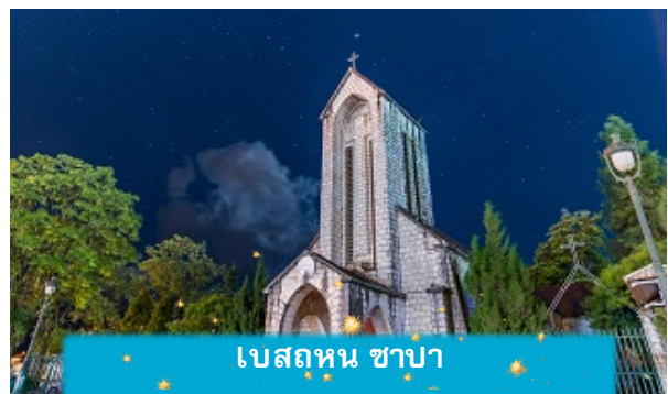
โบสถ์หิน ซาปา