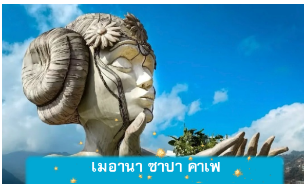
เมอานา ซาปา คาเฟ่

เย็น บริการอาหารค่ำ ณ ภัตตาคาร พิเศษ ... เมนูหม้อไฟแชลมอน + ไวน์แดง ที่พัก SAPA CHARM HOTEL ระดับ 4 ดาวมาตรฐานท้องถิ่น หรือเทียบเท่า