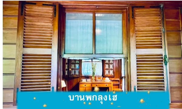
บ้านพกลุงเฮ