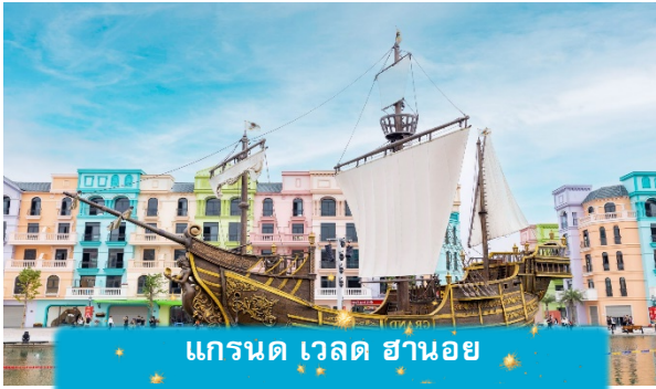
แกรนด์ เวิลด์ สยาม