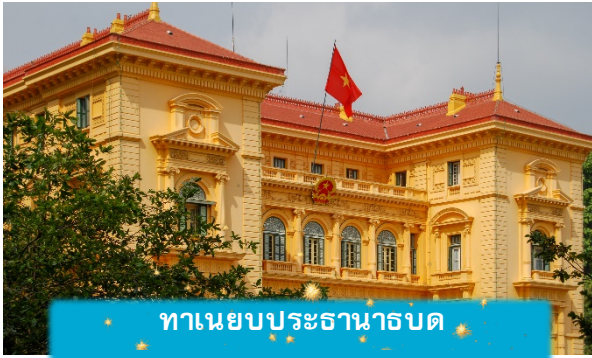
ทานายบประธานาธิบดี