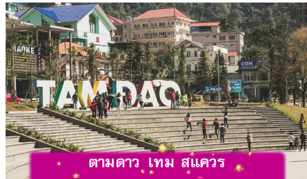
ตามดาว ไทม์ สแควร์

อิสระท่าน ตลาดกลางคืนตามดาว เมื่อแสงแดดลับขอบเขา เมืองบนดอยแห่งนี้จะค่อย ๆ เปลี่ยนบรรยากาศเป็นความคึกคักแบบเรียบง่าย ตลาดกลางคืนตามดาวเต็มไปด้วยของกินพื้นเมือง กลิ่นหอมของหมูย่าง ไชน่กกระทา และข้าวโพดย่างลอยคลุ้งไปทั่ว นักท่องเที่ยวเดินจับจ่าย พุดคุย และหยุดถ่ายรูปตามแสงไฟที่ประดับอยู่ทั่วตลาด บรรยากาศเป็นกันเองและอบอุ่น เหมาะกับการเดินเล่น ปิดท้ายวันด้วยความสุขเล็กๆ ๆ ที่สัมผัสได้