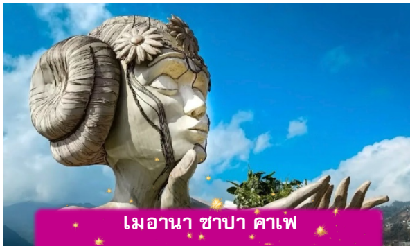
เมอานา ซาปา คาเฟ่

เย็น บริการอาหารเช้า ณ ภัตตาคาร พิเศษ ... เมนูหม้อไฟแชลมอน + ไวน์แดง ที่พัก SAPA CHARM HOTEL ระดับ 4 ดาวมาตรฐานท้องถิ่น หรือเทียบเท่า