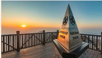
ฟานซิปัน