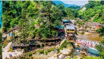
หมู่บ้านก๊ิต ก๊ิต