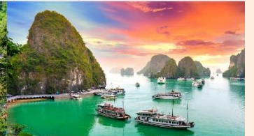
อ่าวฮาลอง

*ทางบริษัทฯ ขอสงวนสิทธิ์ในการสลับโปรแกรมทัวร์ตามความเหมาะสมขึ้นอยู่กับสถานการณ์หน้างาน โดยคำนึงถึงผลประโยชน์ของลูกค้าเป็นสำคัญ