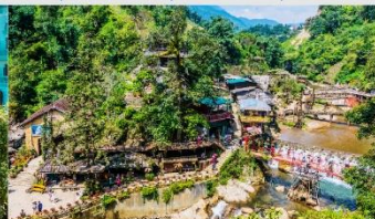
หมู่บ้านก๊ต ก๊ต