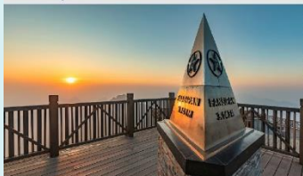
ฟานซิปัน