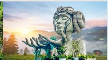
โมอาน่าคาเฟ่

*ทางบริษัทฯ ขอสงวนสิทธิ์ในการสลับโปรแกรมทัวร์ตามความเหมาะสมขึ้นอยู่กับสถานการณ์หน้างาน โดยคำนึงถึงผลประโยชน์ของลูกค้าเป็นสำคัญ