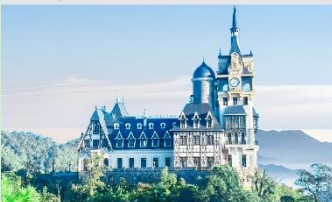
ปราสาทตามดาว