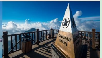
ฟานซิปิน

*ทางบริษัทฯ ขอสงวนสิทธิ์ในการสลับโปรแกรมทัวร์ตามความเหมาะสมขึ้นอยู่กับสถานการณ์หน้างาน โดยคำนึงถึงผลประโยชน์ของลูกค้าเป็นสำคัญ