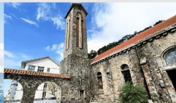
โบสถ์หินตามดาว