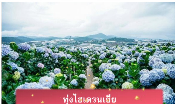
ทุ่งไฮเดรนเยีย

นำท่านเล่น นั่งโรลเลอร์โคสเตอร์ ชมธรรมชาติท่ามกลางป่าสนไปยัง น้ำตกตาดันลา สัมผัสอากาศบริสุทธิ์และบรรยากาศสดชื่น พร้อมจิบเครื่องดื่มชม วิวธรรมชาติ นำท่านเดินทางสู่ ทุ่งไฮเดรนเยีย อีกหนึ่งทุ่งดอกไม้ ที่ไม่ควรพลาดมาถ่ายรูปกัน ข้อดีของที่นี่ คือ ดอกไม้จะบานตลอดทั้งปี