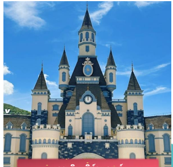
เกาะวินเพิร์ลแลนด์

เที่ยง บริการอาหารกลางวัน ณ ภัตตาคาร พิเศษ ... เมนูบุฟเฟต์บนเกาะ