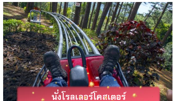
นั่งโรลเลอร์โคสเตอร์