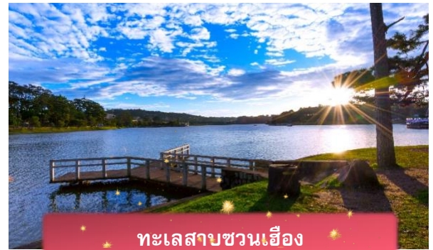
ทะเลสาบชวนเอียง

ที่พัก The Western Hill ระดับ 4 ดาวหรือเทียบเท่า