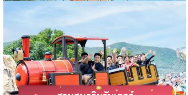
สวนสนุกวินวันเดอร์