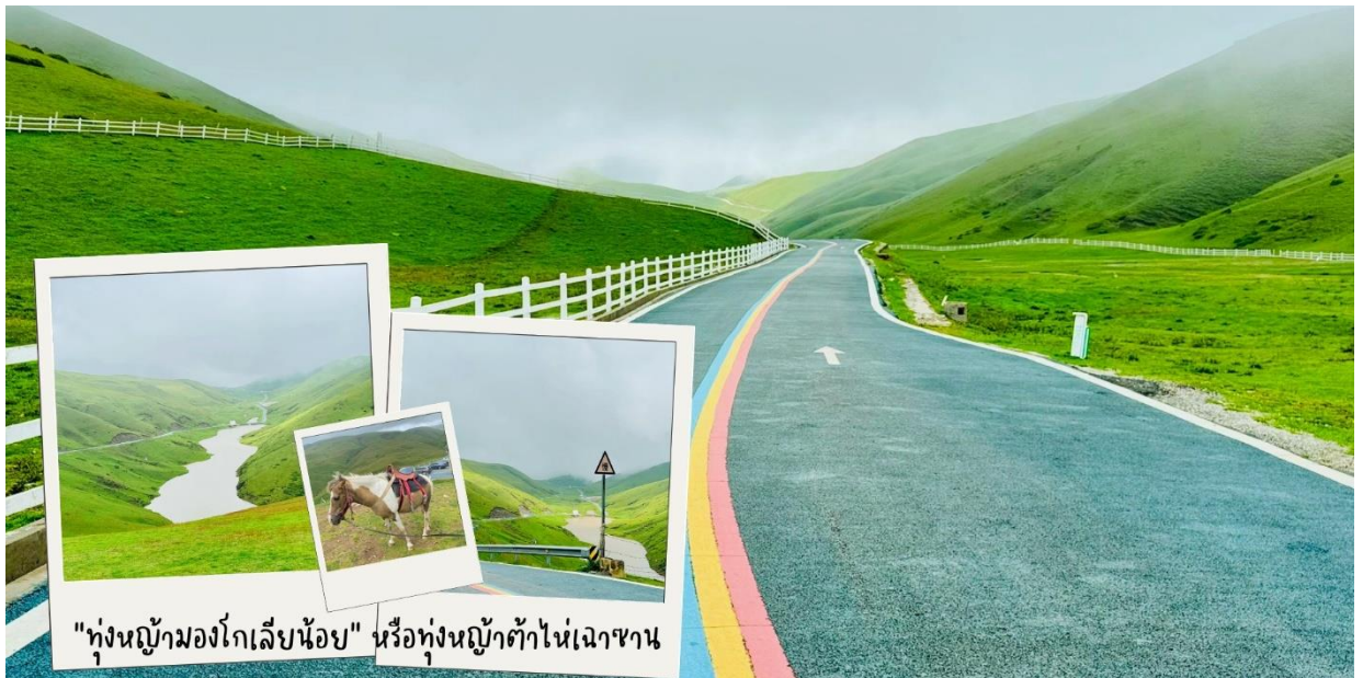
"ทุ่งหญ้ามองโกเลียน้อย" หรือทุ่งหญ้าต้าไห่เฉาซาน

นำท่านเดินทางสู่ต้นตากับ "ทุ่งหญ้ามองโกเลียน้อย" หรือ ทุ่งหญ้าต้าไห่เฉาซาน (Dahai Caoshan) ทุ่งหญ้าอัลไพน์ขนาดใหญ่บนความสูงกว่า 3,500 เมตรเหนือระดับน้ำทะเล ที่ได้รับฉายาว่า ภูเขาแห่งมองโกเลียน้อยหรือ ภูเขาแห่งมองโกเลียใต้(ไม่รวมรถแบดเตอร์) ตั้งอยู่ห่างจากตัวเมืองฮุยเจ้อประมาณ 1 ชั่วโมง ภูเขาทุ่งหญ้าฮุยเจ้อ เป็นสถานที่ท่องเที่ยวทางธรรมชาติระดับ AAAA มีพื้นที่ครอบคลุม 180,000 เอเคอร์ ซึ่งประกอบด้วยภูเขา ทุ่งหญ้า ดอกไม้ เนินดินและลำธาร และสายหมอกให้ความรู้สึกสงบสุขเมื่อได้เยี่ยมชมเย็นจนได้รับขนานนามจากนักท่องเที่ยวว่า "นิวซีแลนด์ตะวันออก" ระหว่างทางเส้นทางนี้รถขึ้นไปบนภูเขาจะผ่านทุ่งนาชั้นบันได ทุ่งหญ้าแห่งนี้สูงสูงกว่าระดับน้ำทะเลระหว่าง 3,000-4,000 เมตร ภูเขาทุ่งหญ้ามีทิวทัศน์สวยงาม อากาศเย็นสบายตลอดทั้งปี ในช่วงฤดูร้อน ระหว่างเดือน กรกฎาคม - กันยายน จะเป็นช่วงทุ่งหญ้าสีเขียวขจี และจะกลายเป็นสถานที่เลี้ยงสัตว์ของชนเผ่าหยา