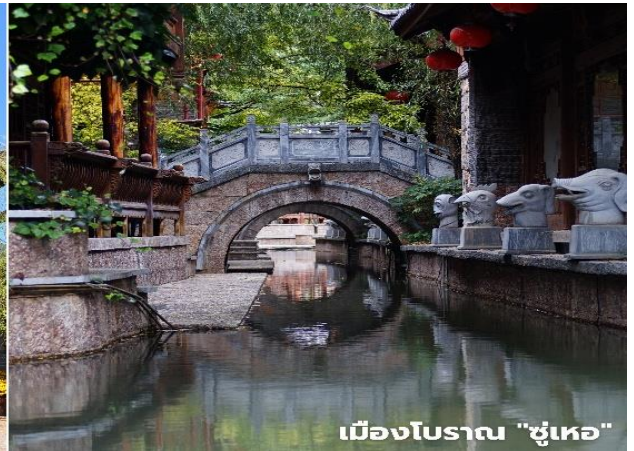
เมืองโบราณ "ชู่เหอ"