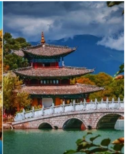
สระมัจจรด้า

จากนั้นนำท่านเดินทางสู่เมืองคุนหมิงโดยนั่งรถไฟความเร็วสูง C456:13:01-17:01 (รวมรถชนกระเป่า) ออกระพภผอน