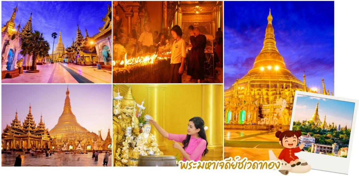
พระมหาเจดีย์ชเวดากอง

พิกัดสายมูสุดฮิตทั้ง 2 จุดนี้ ประดิษฐานอยู่ภายในบริเวณลานพระมหาเจดีย์ชเวดากอง (Shwedagon Pagoda) ณ นครย่างกุ้ง ซึ่งเป็นมหาเจดีย์คู่บ้านคู่เมืองที่ใหญ่ที่สุดของเมียนมา หากคุณกำลังวางแผนไปกราบไหว้สิ่งศักดิ์สิทธิ์ทั้งสององค์ สามารถปรึกษาและปฏิบัติตามเคล็ดลับการไหว้ได้ดังนี้