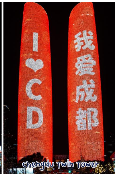
Chengdu Twin Tower