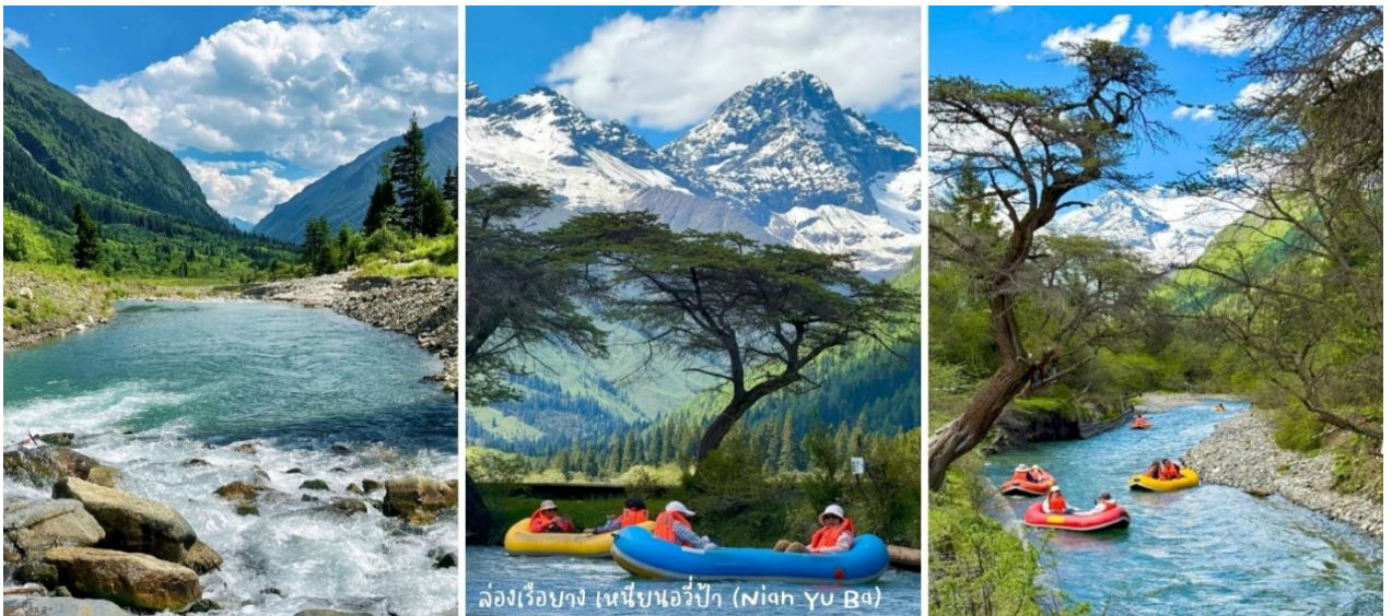
ล่องเรือยาง เหนียนอวีป่า (Nian Yu Ba)

*ขอสงวนสิทธิ์ในการคืนค่าล่องเรือในกรณีที่ท่านไม่ใช้บริการ **