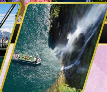
ล่องเรือมิลฟอร์ด ซาวัน