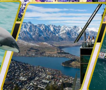
ยอดเขานีออนส์พีค