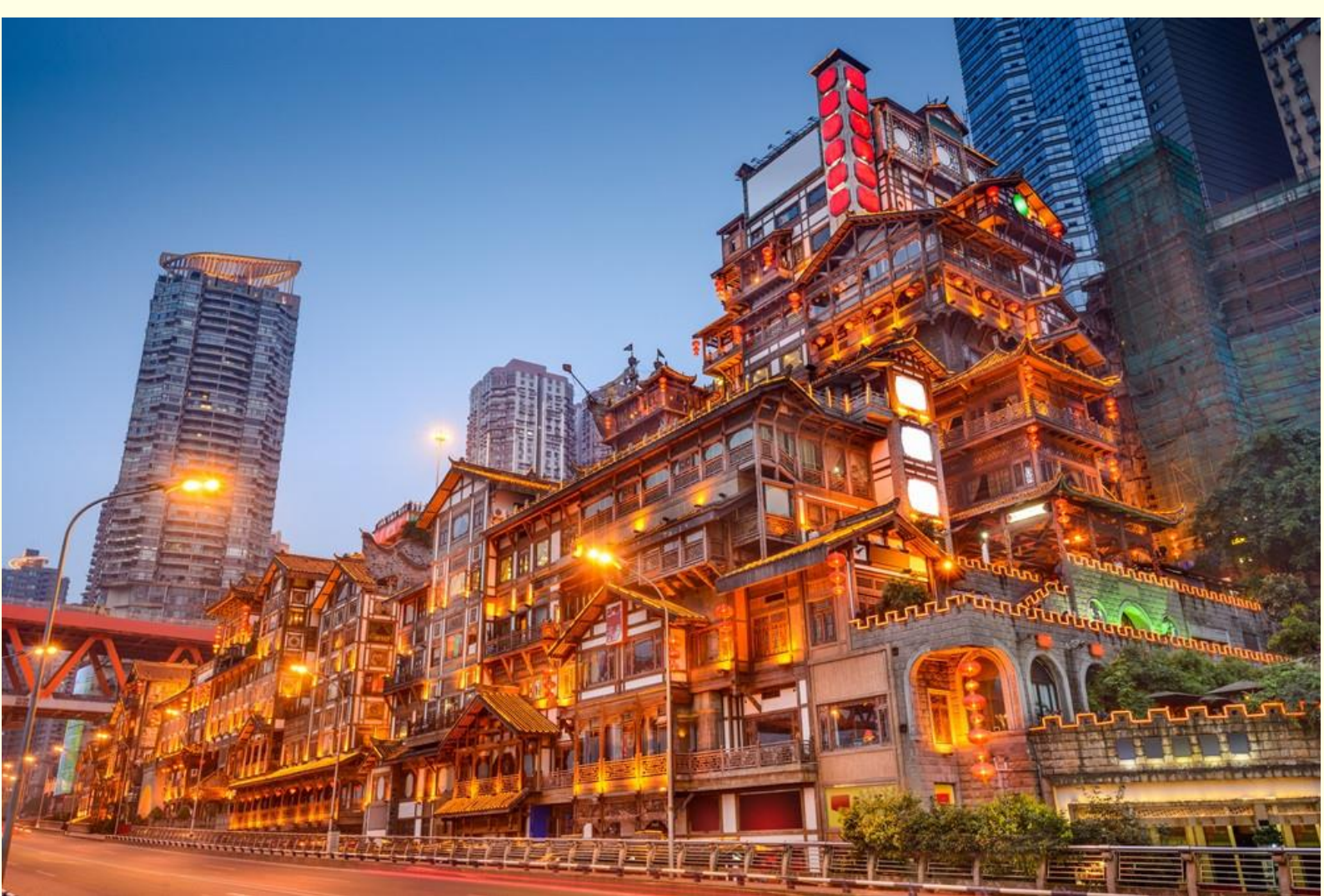
เอกลักษณ์ของเมืองฉงชิ่ง

จากนั้นนำท่านเดินทางสู่ หงหยาดัง (Hongyadong) อาคารคอมเพล็กซ์ขนาดใหญ่สูง 16 ชั้น ตั้งอยู่ริมฝั่งแม่น้ำเจียงหลิง ภายในมีร้านค้า ร้านอาหาร โรงแรม ร้านขายสินค้าที่ระลึก ฯลฯ ที่นี่ยามค่ำคืนถือเป็นจุดนัดพบพักผ่อนของชาวเมือง และจุดชมวิวชั้นดี อีกทั้งยังเป็นจุดถ่ายรูปที่สำคัญของนักท่องเที่ยวอีกด้วย พร้อมชมไฟยามค่ำคืนของสถาปัตยกรรมจีนโบราณ โดดเด่นตระหง่านเป็น