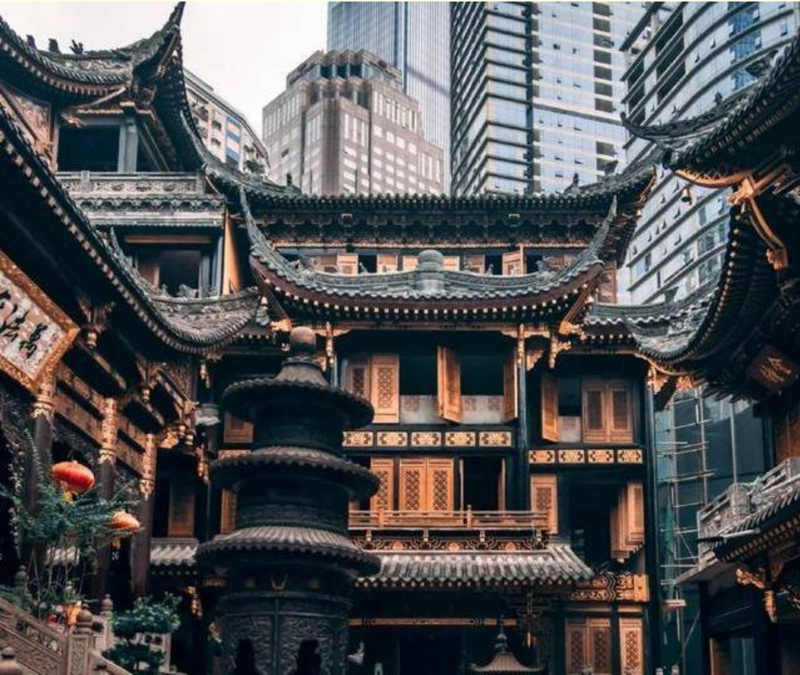
ของฉงชิ่งได้อย่างสมบูรณ์แบบ

จากนั้นนำท่านไป วัดหลวงฮั่น แลนด์มาร์กใจกลางนครฉงชิ่ง ไฮไลต์คือการเข้าไปสักการะองค์พระอรหันต์ดินเผาแกะสลักที่มีชื่อเสียงถึง 500 องค์ ซึ่งแต่ละองค์จะมีสีหน้า ท่าทาง และอารมณ์ที่แตกต่างกันไปอย่างประณีตงดงาม นอกจากนี้วัดแห่งนี้ยังเป็นสถานที่ถ่ายทำภาพยนตร์ชื่อดังของจีน ทำให้มีทั้งผู้คนแวะเวียนมาตามรอยและผู้แสวงบุญมาขอพรเรื่องความสำเร็จอย่างไม่ขาดสาย ถือเป็นจุดเช็กอินที่สะท้อนเสน่ห์ความต่างขั้วระหว่างความทันสมัยและกลิ่นอายวัฒนธรรมเก่าแก่