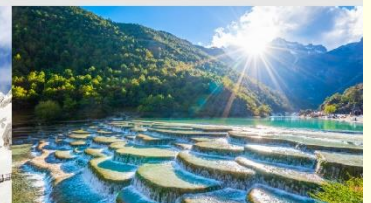
ทะเลสาบไป๋สุ่ยเหอ

*ทางบริษัทฯ ขอสงวนสิทธิ์ในการสลับโปรแกรมทัวร์ตามความเหมาะสมขึ้นอยู่กับสถานการณ์หน้างาน โดยคำนึงถึงผลประโยชน์ของลูกค้าเป็นสำคัญ