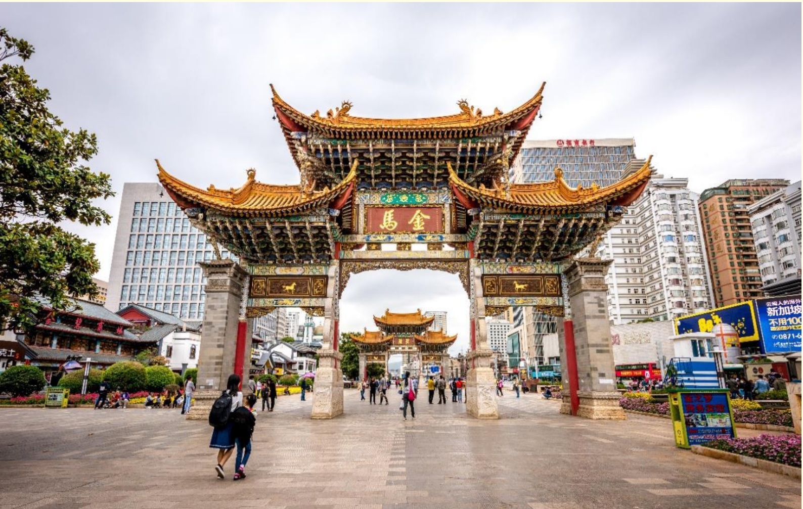
ตามอัธยาศัย

จีนและต่างประเทศ รวมทั้งเครื่องประดับ อัญมณี ร้านเครื่องดื่ม ร้านอาหารพื้นเมือง และร้านขายของที่ระลึก ฯลฯ อิสระให้ท่านเลือกช้อปปิ้งตามอัธยาศัย ใกล้กันให้ท่านได้ช้อปปิ้งไอเท็มสุดฮิตที่มาแรงในตอนนี้ POP MART ที่อยู่ชั้นใต้ดิน ตรงข้ามกับซุ้มประตูม้าทองไก่อหยก สวากป้อปมาร์ทห้ามพลาด อิสระให้ท่านได้เดินช้อปปิ้ง