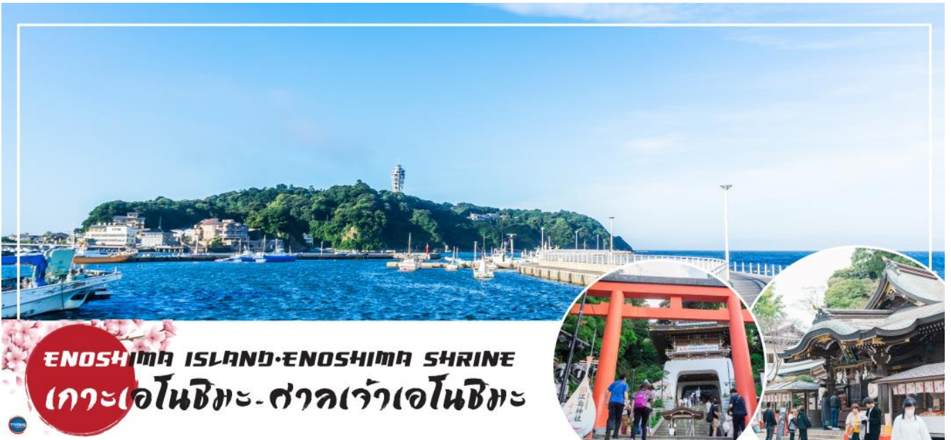
ENOSHIMA ISLAND · ENOSHIMA SHRINE เกาะเอโนชิมะ - ศาลเจ้าเอโนชิมะ

วันที่สอง ท่าอากาศยานนานาชาติ นาริตะ – จังหวัดคานากาวะ – เกาะเอโนชิมะ – ศาลเจ้าเอโนชิมะ – ถนนเป็นไซเท็นนากามิสะ – จังหวัดยามานาชิ – หมู่บ้านโอชิโนะฮัตไต – ออนเซ็น + ขาปุยักษ์