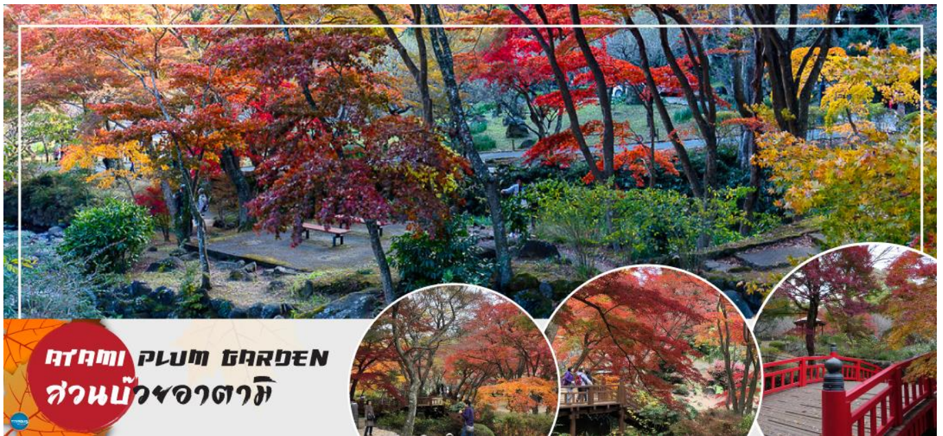
ATAMI PLUM GARDEN สวนบ๊วยอาตามิ

นำท่านชมความงามของใบเมเปิ้ลเปลี่ยนสี ประมาณ 380 ต้น ณ สวนบ๊วยอาตามิ (ATAMI PLUM GARDEN) สวนญี่ปุ่นชื่อดังที่ได้รับการยกย่องว่าเป็นหนึ่งในจุดชมใบไม้เปลี่ยนสีที่สวยงามที่สุดในภูมิภาคชูบุ เพลิดเพลินกับทัศนียภาพอันงดงามของใบเมเปิ้ลสีแดง ส้ม และเหลือง ที่แต่งแต้มทั่วทั้งสวน สร้างบรรยากาศโรแมนติกท่ามกลางธรรมชาติในช่วงปลายฤดูใบไม้ร่วง และจะมีบ่อสำหรับแช่เท้าซึ่งใช้น้ำที่ไหลจากตาน้ำพุร้อนโดยตรงและร้านขายของที่ระลึกเปิดให้บริการอีกด้วย (ขึ้นอยู่กับสภาพอากาศ)