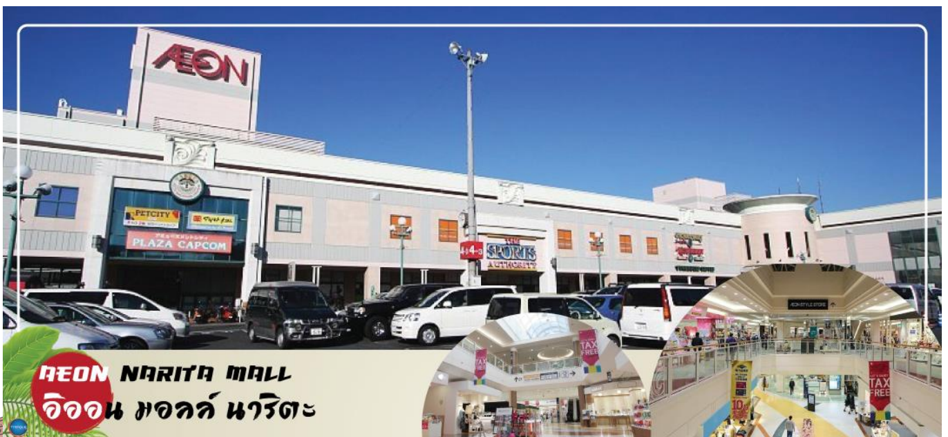
AEON NARITA MALL อโชน มอลล์ นาริตะ

จากนั้นเดินทางสู่ อโชน มอลล์ นาริตะ (Aeon Narita Mall) ห้างสรรพสินค้าที่นิยมในหมู่นักท่องเที่ยวชาวต่างชาติ เนื่องจากตั้งอยู่ใกล้กับสนามบินนานาชาตินาริตะ ภายในตกแต่งในรูปแบบที่