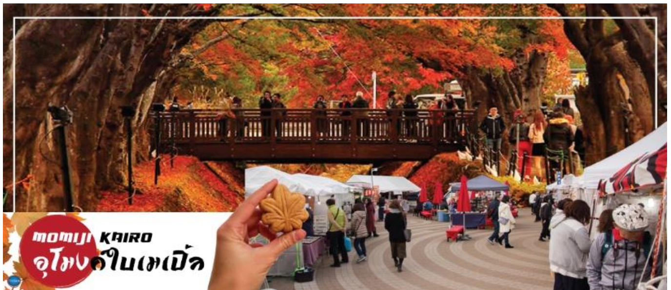
MOMIJI KAIRO อุโมงค์ใบเมเปิ้ล

จังหวัดยามานาชิ – พิธีชงชาญี่ปุ่น – จุดชมวิวยทะเลสาบคาวากูจิโกะ หรือ อุโมงค์ใบเมเปิ้ล (ขึ้นอยู่กับฤดูกาล) – เมืองอาตามิ – สวนบ๊วยอาตามิ – ศาลเจ้าคิโนะมิมะ – เมืองนาริตะ – อโอมอลล์