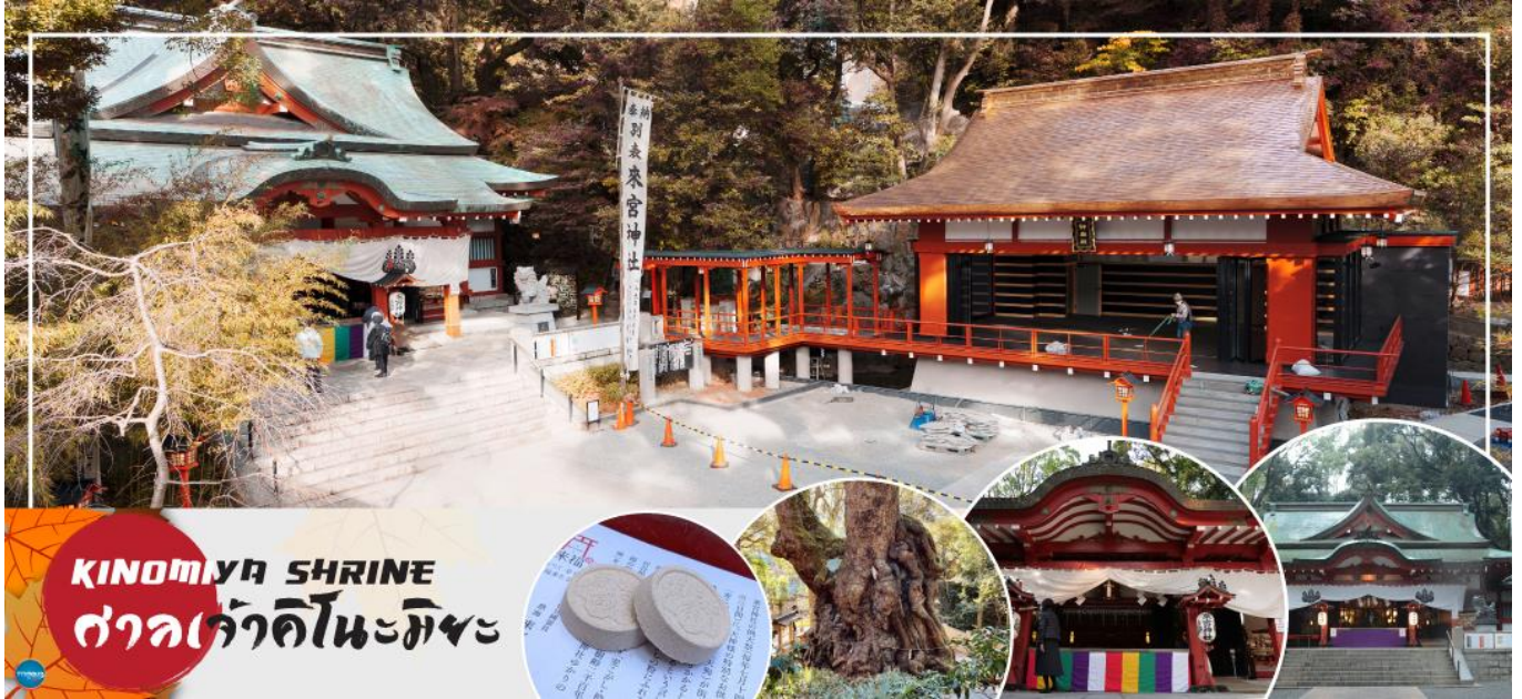
KINOMIYA SHRINE ศาลเจ้าคิโนะมียะ

จากนั้นนำท่านสู่ ศาลเจ้าคิโนะมียะ (Kinomiya Shrine) เป็นศาลเจ้าที่ ชะกะโนะอุเอะโนะ ทะมูระมะโระ หนึ่งในโชกุนต้นสมัยเฮอันได้มาขอพรก่อนที่จะได้รับชัยชนะจากการออกรบ เพราะที่นี้ถือเป็นที่ยึดถือของเทพเจ้าทั้งหลาย ซึ่งในปัจจุบันที่นี้ถือเป็นตัวแทนของศาลเจ้าคิโนะมียะทั้ง 44 ศาลเจ้าทั่วประเทศ เป็นศูนย์รวมของความเคารพบูชา นอกจากนี้ยังมีอนุสาวรีย์ ธรรมชาติแห่งชาติ และยังมีต้นไม้ยักษ์ขนาดเส้นผ่านศูนย์กลาง 24 เมตร ตั้งอยู่ในสุดเขตวัด ว่ากันว่าหากเดินวนรอบต้นไม้หนึ่งรอบ อายุก็จะยาวขึ้นไปอีกหนึ่งปีแม้ที่นี้จะดูน่าเกรงขามแต่พอ