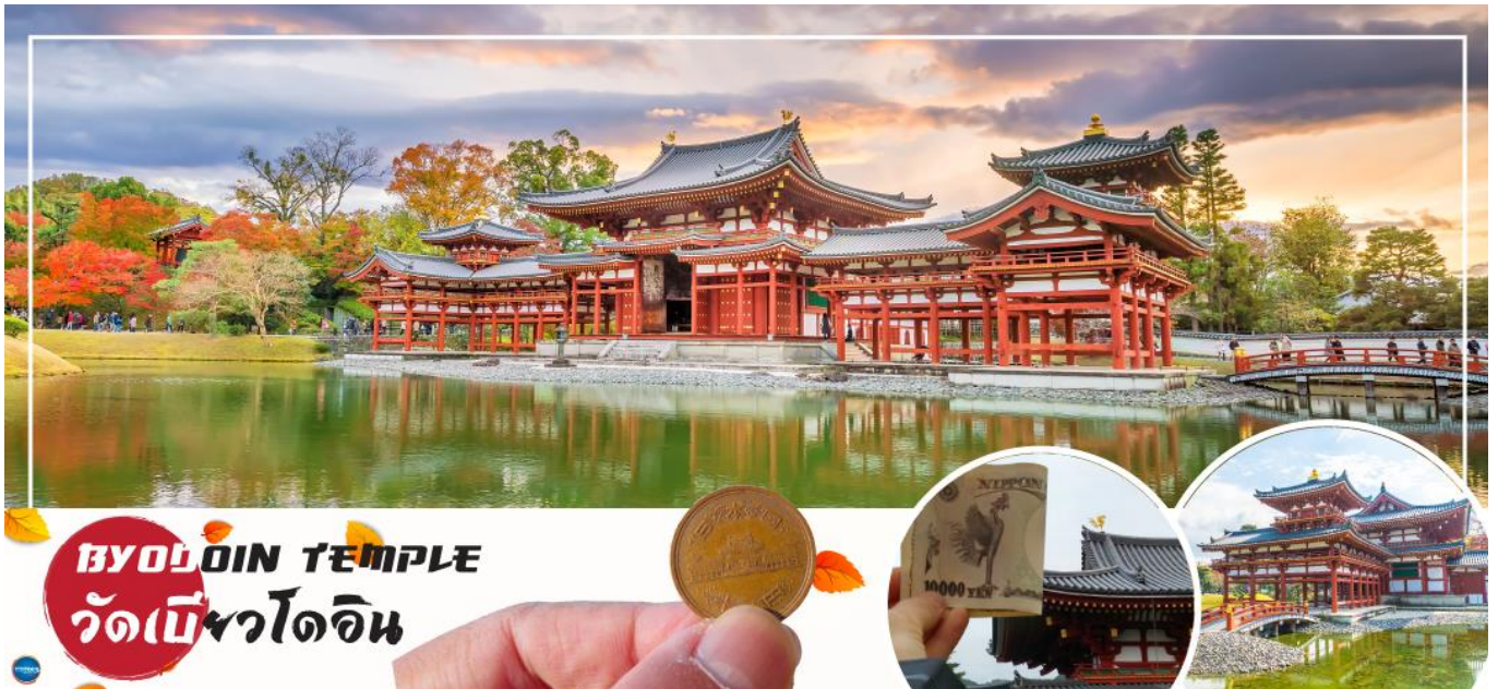
BYODOIN TEMPLE วัดเบียวโดอิน

00.55 น. ออกเดินทางสู่ เมืองโอซาก้า ประเทศญี่ปุ่น โดยเที่ยวบินที่ XJ612 สายการบิน AIR ASIA X ใช้เครื่อง AIRBUS A330-300 จำนวน 377 ที่นั่ง จัดที่นั่งแบบ 3-3-3 (น้ำหนักกระเป๋า 20 กก./ท่าน หากต้องการซื้อน้ำหนักเพิ่ม ต้องเสียค่าใช้จ่าย)