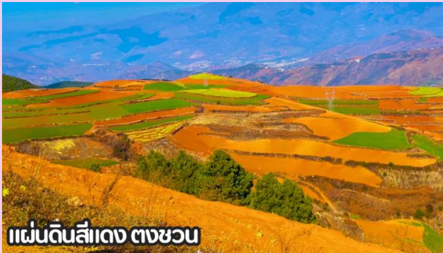
แผ่นดินสีแดง ตงชว่น

นำทุกท่านเดินทางสู่ เมืองตงชว่น (DONGCHUAN) หรือที่รู้จักกันในชื่อ หงถู่ตี้ ซึ่งแปลว่าแผ่นดินสีแดง เมืองตงชว่นตั้งอยู่ทางทิศตะวันออกเฉียงเหนือของมณฑลยูนหนาน มีภูมิประเทศเป็นทิวเขาสลับซับซ้อน ชาวพื้นเมืองส่วนใหญ่ประกอบอาชีพปลูกข้าวสาลี มันสำปะหลัง ผักต่างๆและดอกไม้มานานาพันธุ์ และตงชว่น ยังถือว่าเป็นจุดท่องเที่ยวไฮไลต์อีกหนึ่งแห่งของคุณหมิง เป็นจุดที่นักท่องเที่ยวนิยมแวะมาเก็บภาพบรรยากาศที่สวยงาม นำท่านชม ภูเขาเจ็ดสีแห่งตงชว่น หรือ แผ่นดินสีแดง (DONGCHUAN RED LAND) ตั้งอยู่ในเขต