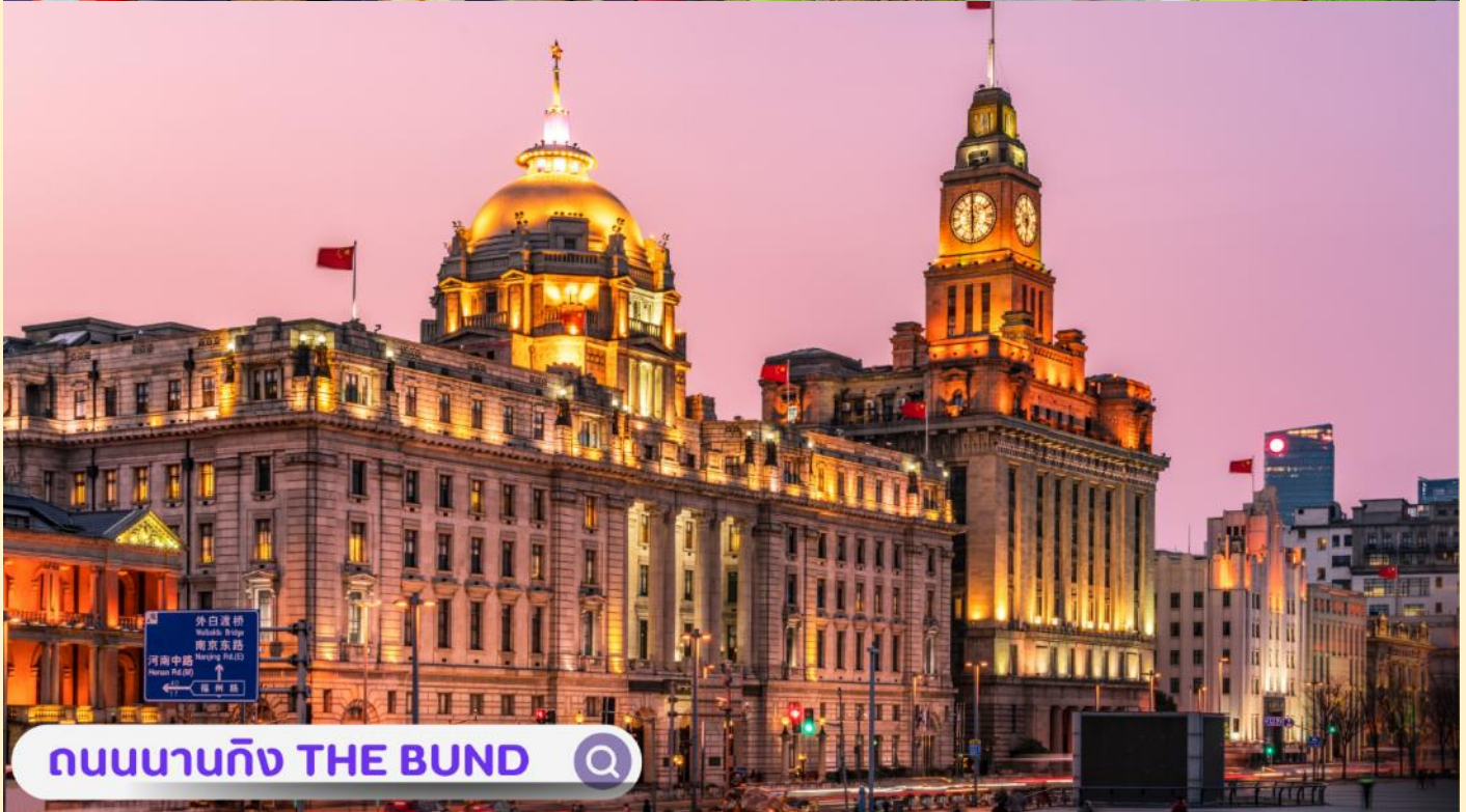
ถนนนานกิง THE BUND

จากนั้นอิสระท่านเพิลิตเพลินที่ ถนนนานจิง(NANJING ROAD) เป็นย่านช้อปปิ้งเก่าแก่ที่สุดของเซี่ยงไฮ้ เป็นตลาดซื้อขายของกันคึกคักตั้งแต่ทศวรรษ 1920 ตั้งอยู่ฝั่งผู้ซีกินพื้นที่ยาวตั้งแต่ฝั่งตะวันตกของ “เดอะ บันด์” ถึง “พีเพิลส์ สแควร์” เป็นแหล่งช้อปปีงสินค้าแบรนด์เนมจากทั่วโลก และยังเป็นศูนย์รวมร้านค้าและร้านอาหารอีกมากมาย และพลาดไม่ได้กับนักจุ่มอาร์ทอช้อยอย่าง แบรินด์ POPMART GLOBAL FLAGSHIP STORE ร้านขายของเล่นที่เป็นที่โด่งดังในขณะนี้ไม่ว่าจะ LABUBU MOLLY SKULLPANDA และอย่างอื่นอีกมากมาย ให้ท่านได้เลือกลุ้นกันอย่างสนุกสนาน