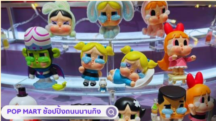
POP MART ซ้อปิ้งถนนนานกิง