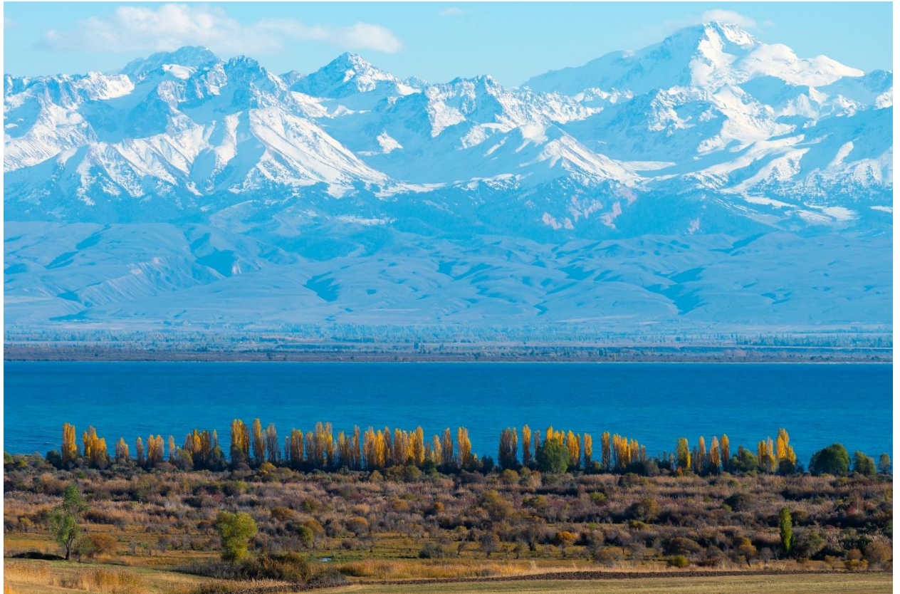
เห็นเงาของเทือกเขาผ่านแผ่นทะเลสาบเหมือนกระจก

จากนั้นชม ทะเลสาบอีซซิกกุล (ISSYK KUL LAKE) ทะเลสาบน้ำเค็มที่ใหญ่เป็นอันดับ 10 ของโลก โดยใหญ่ที่สุดในคีร์กีซสถาน และอันดับที่ 7 ทะเลสาบที่ลึกที่สุดในโลก “อีซซิกกุล แปลว่า ทะเลสาบน้ำอุ่น” จึงทำให้ที่แห่งนี้ไม่เคยเป็นน้ำแข็ง แม้จะตั้งอยู่ในดินแดนทางตอนเหนือของเทือกเขาเทียนชานซึ่งมีอุณหภูมิช่วงฤดูหนาวต่ำกว่าจุดเยือกแข็งก็ตาม และด้วยความอุ่นของทะเลสาบนี้เองทำให้บรรยากาศแถบนี้มีความเฉพาะตัว นอกจากนี้ยังรายล้อมไปด้วยเทือกเขาเทียนชาน ส่วนบนจะเห็นเป็นภูเขาหิมะ พื้นน้ำจะสะท้อน