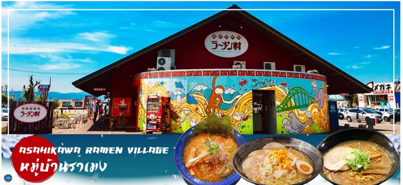
ASAHIKAWA RAMEN VILLAGE หมู่บ้านราเมง

เมืองอาซาฮิคาว่า – ศาลเจ้าคามิดาวะ – หมู่บ้านราเมงอะซาฮิยามา – สวนสัตว์อะซาฮิยามา – เมืองซัปโปโร – ย่านชูชุกิโนะ